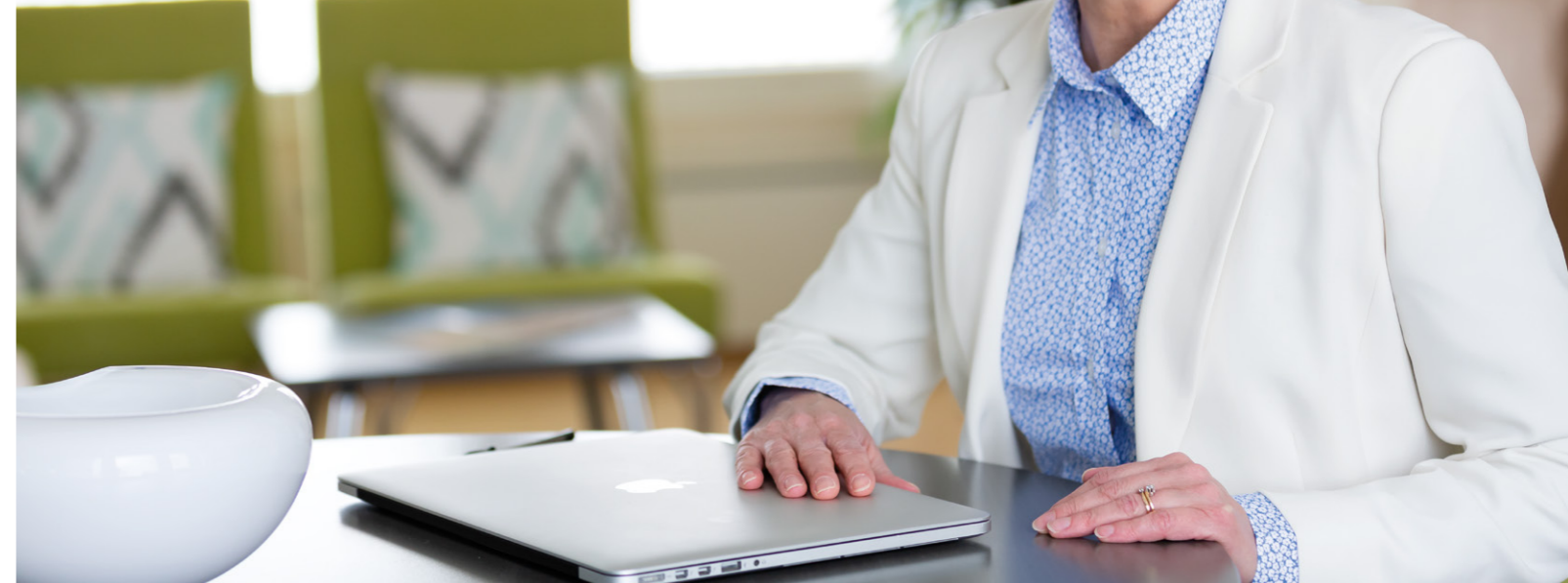
Tuula Loikkanen toimitusjohtaja

Verkko Korpelan liikevaihto oli 13,9 milj. euroa (13,6), mistä sähkönsiirron osuus oli 11,1 milj. euroa (10,3). Liikevoitto oli 0,89 milj. euroa (0,78) ja tilikauden voitto oli 0,7 milj. euroa (0,7). Yhtiön omavaraisuusaste palautuskelpoiset liittymismaksut huomioiden oli 22,13 % (14,02). Verkko Korpela ei jaa omistajalleen osinkoa.